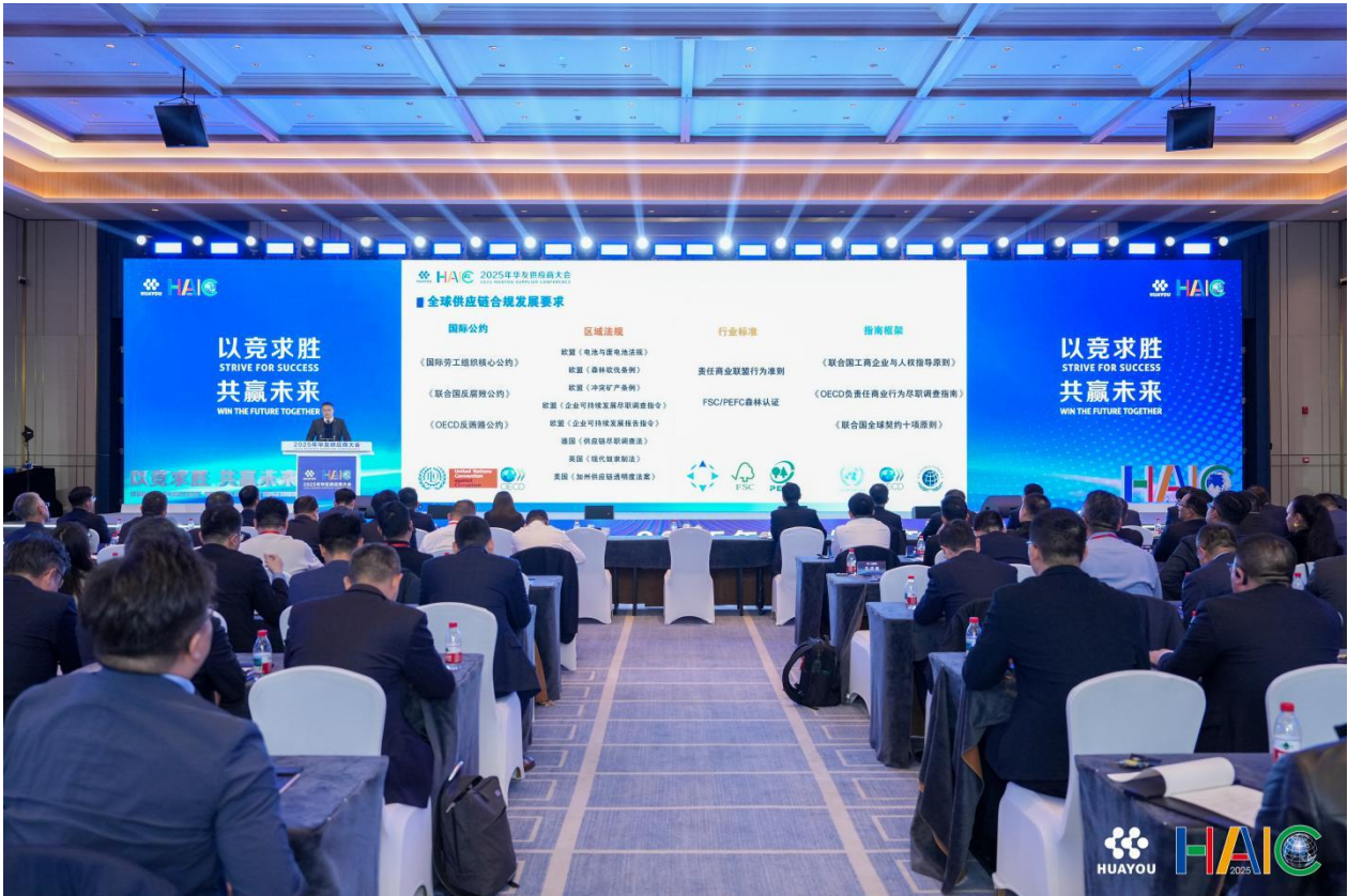
图 1：2025 年 11 月 26 日下午，以“以竞求胜，共赢未来”为主题的华友 2025 年度供应商大会在乌镇国际互联网会展中心隆重召开。来自海内外的 130 多家合作单位、400 余位嘉宾参会，大会明确提出“更加强调可持续发展，以 ESG 竞争力拓宽发展空间”。可持续发展中心总经理助理吕基成代表公司作《链创未来，共筑永续——携手共建可持续供应链报告》，从尽责管理、绿色低碳、供应商能力共建等维度，明确了华友携手供应商打造透明、韧性、可持续矿产供应链的具体行动方向。

公司积极参与国际以及行业对话，了解负责任矿产供应链尽责管理的行业解决方案的最新资讯，并积极反馈公司自身建设中碰到的问题。