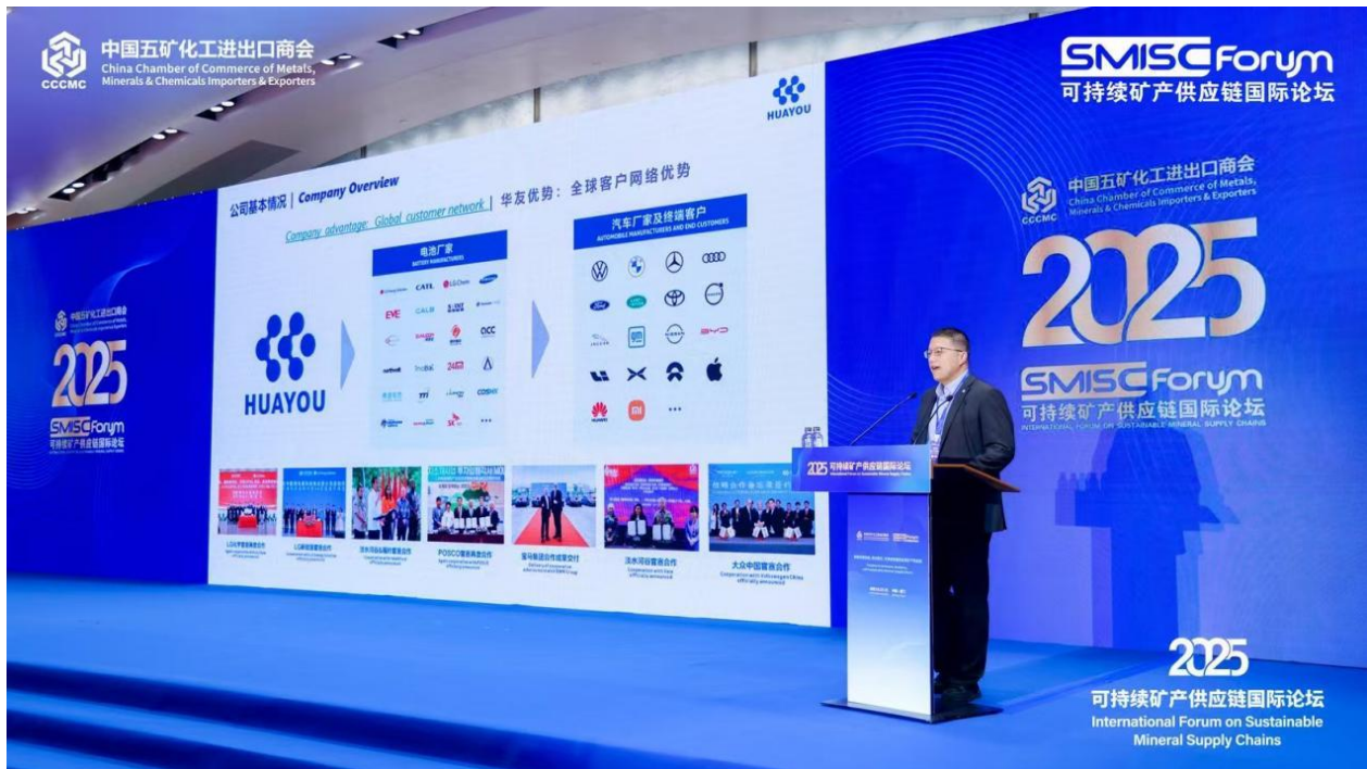
图 3: 2025 年 9 月 23 日-25 日, 由中国五矿化工进出口商会主办的第三届可持续矿产供应链国际论坛 (SMISC